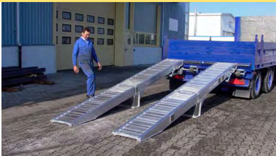
Le modèle présenté en photo sur cette page comporte les deux options : articulation et équilibrage.

Les systèmes d'équilibrage sont prévus pour être installés sur les rampes de type AVS 150, AVS 170 et AVS 200. Deux modèles existent : pour rampes largeur 450 mm ou 600 mm.