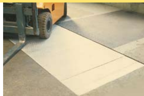
Capacité à la demande